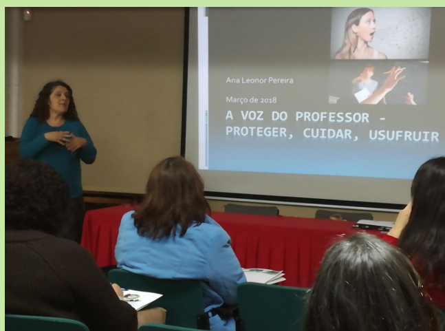
Escola secundária DR. Ginestal Machado, Santarém