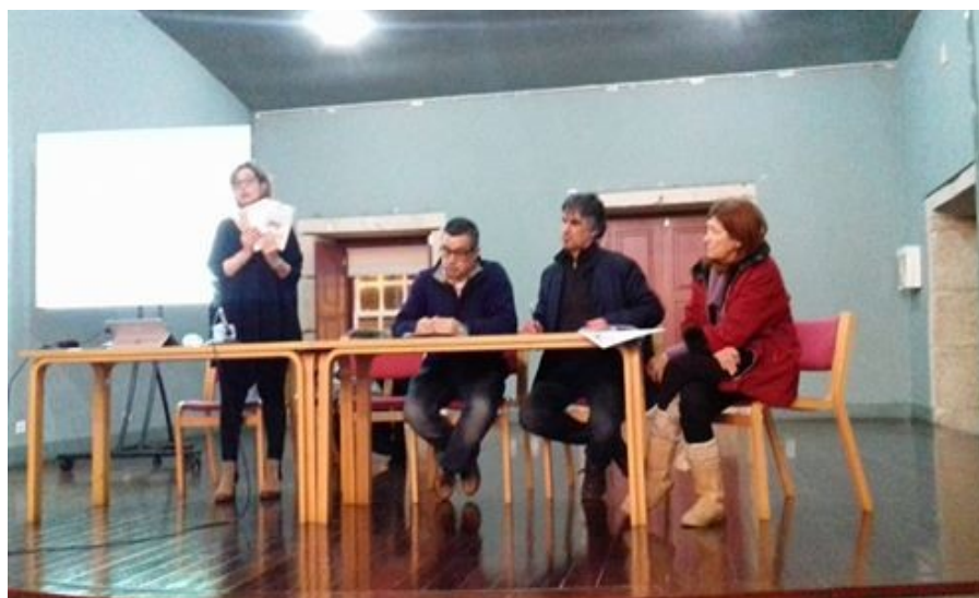
Guarda - 2 de março