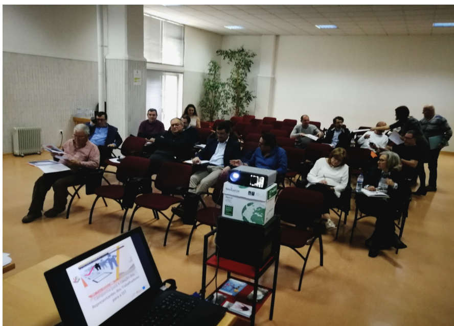
Leiria - 1 de março