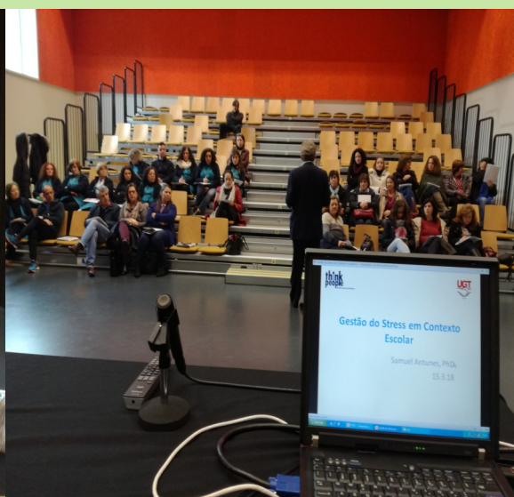
Escola Secundária Garcia da Orta, Porto